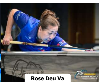
Rose Deu Va